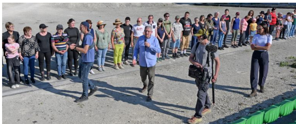
Chaque saison, le spectacle Des Flammes à la lumière brasse environ 400 bénévoles.

C'est aussi pour cela que Jean-Luc Demandre insiste régulièrement sur la nécessité de renouveler les équipes. Les départs se font naturellement, au fil des années, et l'association doit sans cesse accueillir de nouveaux bras. Les besoins ne concernent pas seulement les figurants. Ils touchent aussi la logistique, l'intendance ou encore la